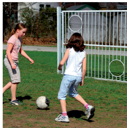
6.72265 doelwand, staal

Doelwand bestaande uit een stalen spijlenhek met twee balgaten bevestigd tussen twee ronde staanders.