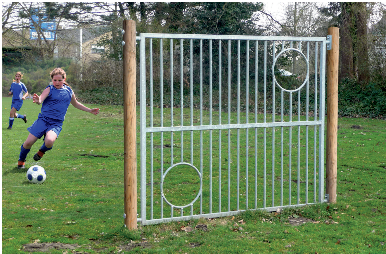
6.72260 doelwand, hout