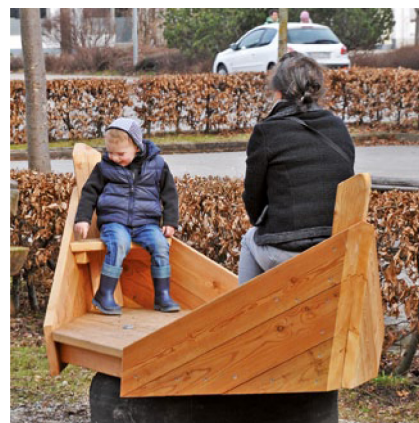
6.08000 golvend schip

Het golvend schip bestaande uit een spannend schip gemaakt van hout. Door de schuine hoeken geeft het een prachtige vorm met zich mee. Op het schip zijn twee vaste zitplekken, links en rechts. Verder kan er op de bodem van het schip ook plaatsgenomen worden om de activiteit met elkaar aan te gaan. Door de rubberen band onder het schip komt er beweging vrij zodra er kinderen of volwassenen op het toestel plaatsnemen.