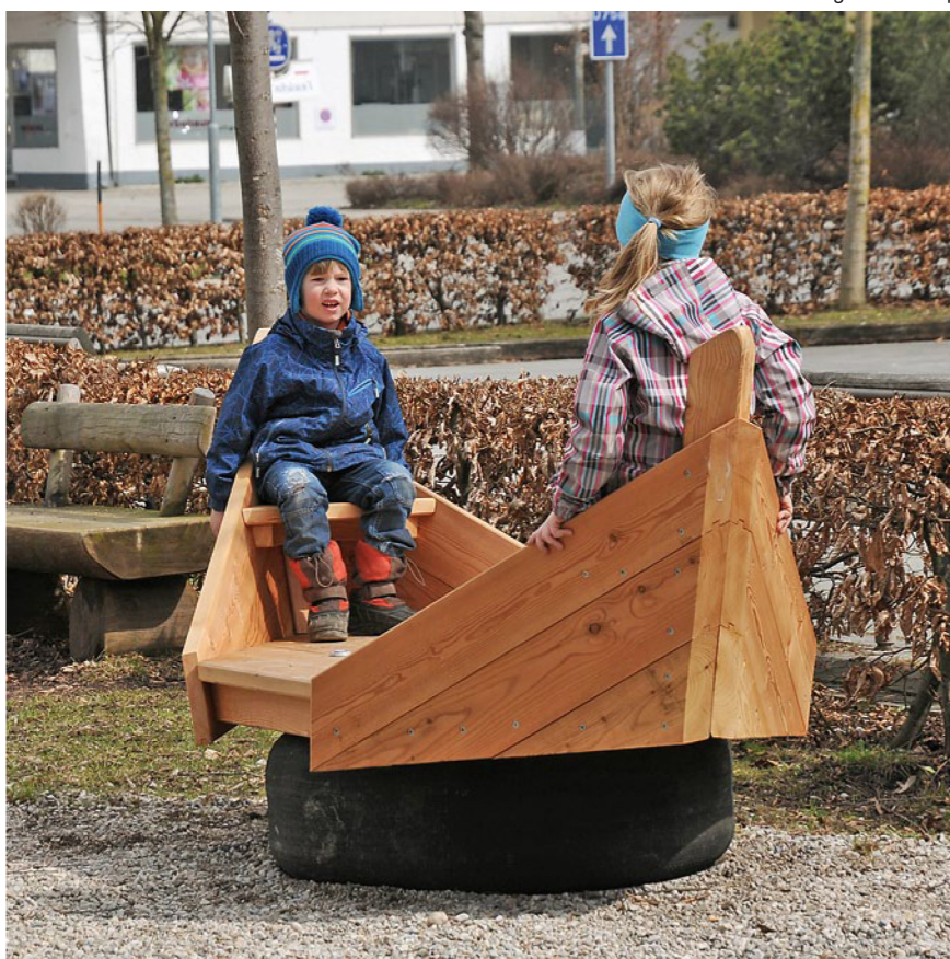
6.08000 golvend schip

Wijzigingen voorbehouden. Met deze uitgave komen alle vorige versies te vervallen. SPERECO 2021