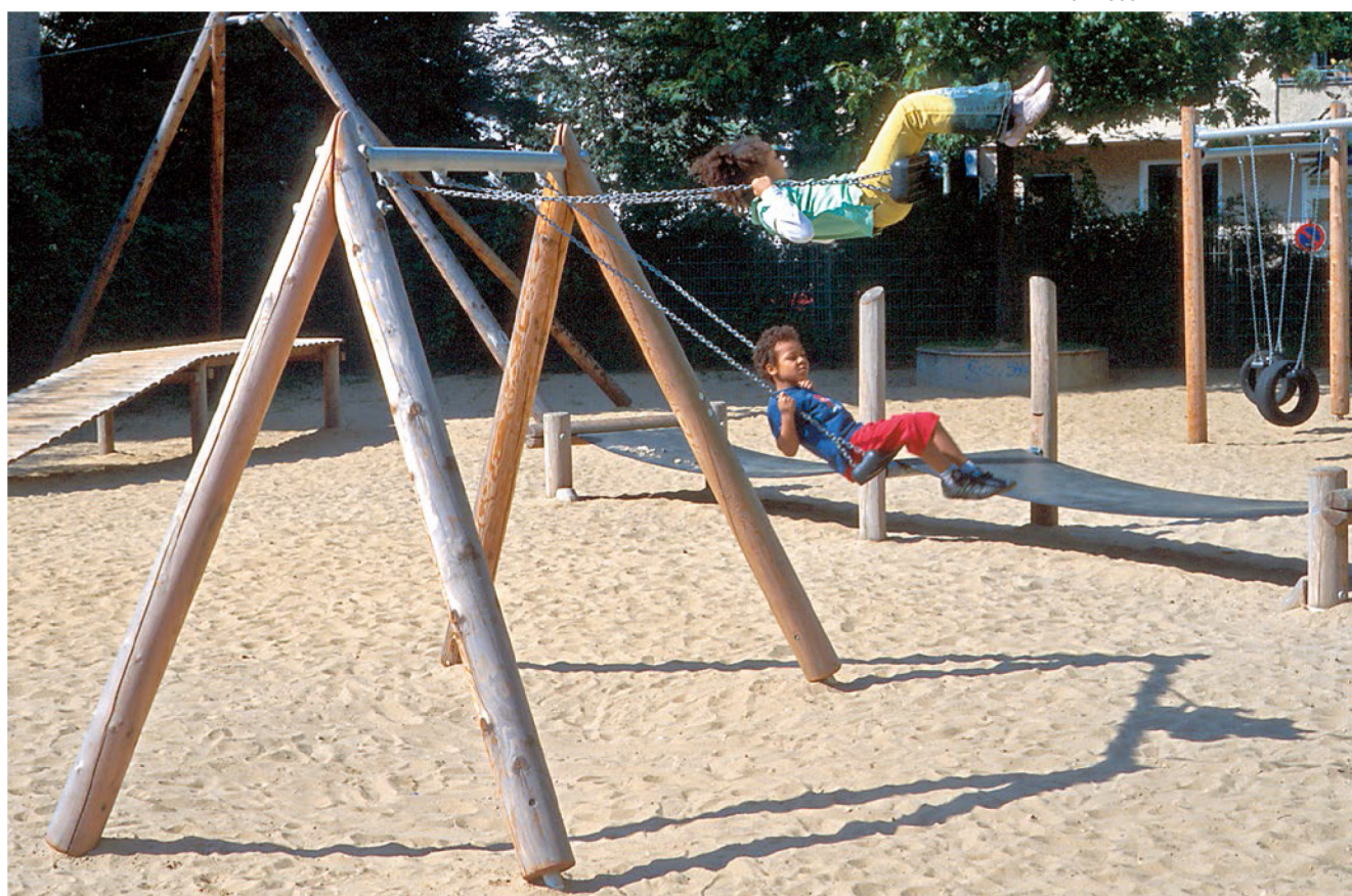
6.12820 dubbele weide schommel speciaal