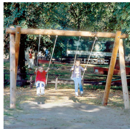
6.12800 dubbele weide schommel

Verschillende soorten en afmetingen schommels opgebouwd uit lariks hout. De ene heeft een stalen dwarsbalk en de andere is afgewerkt met een houten dwarsbalk. Een mooie uitstraling voor toe te voegen bij een speelplek.