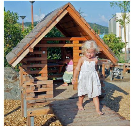
4.10900 huizengroep C

Huizengroep C bestaande uit drie paaldorphanen. Twee paaldorphanen onderling verbonden met een brede brug die bereikbaar is via een hellend toegangspad. Een paaldorphan staat los van de anderen en is ook bereikbaar via een trapje.