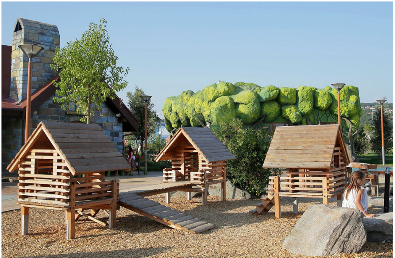
4.10900, huizengroep C