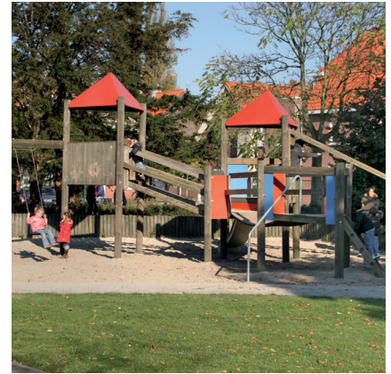
11.59716 speellandschap Julius, hout