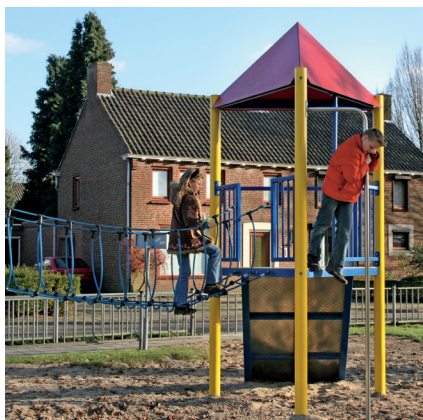
11.59810 speellandschap Anton, staal, zie boven