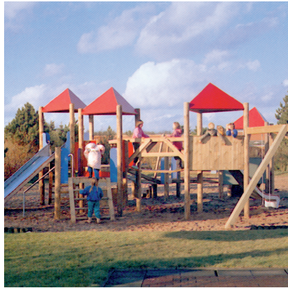
11.59717 speellandschap Nora, hout