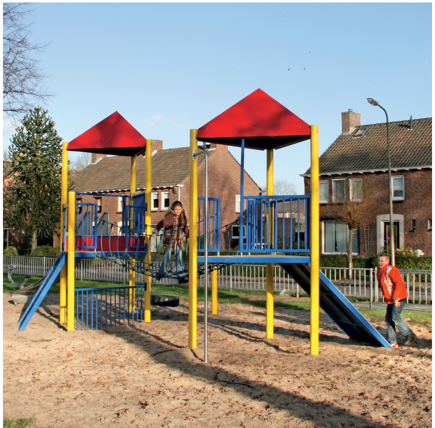
11.59810 speellandschap Anton, staal, optioneel gecoat, met netbrug i.p.v. hangbrug