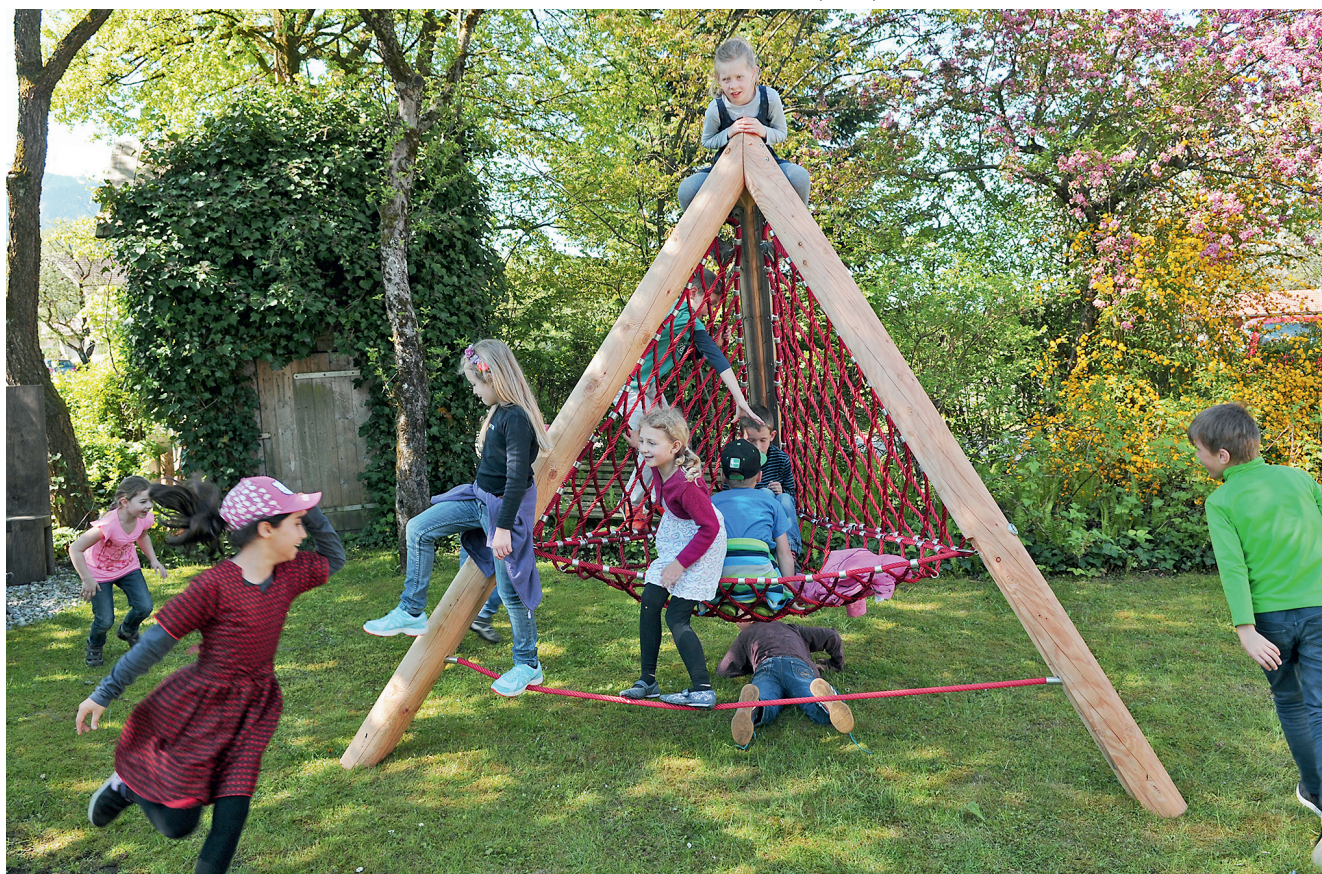
4.19200 touw pyramide