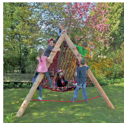
combinatie voorbeeld (model)