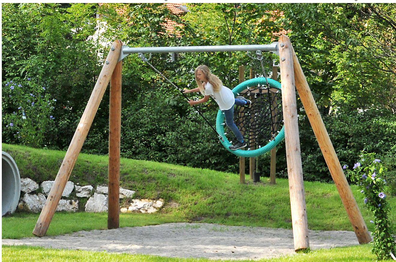
6.14520 vogelnestschommel met stalen dwarsbalk