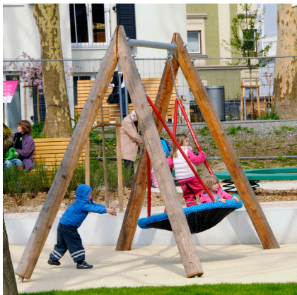
6.14520 vogelnestschommel met stalen dwarsbalk

Vogelnestschommel bestaande uit een houten of stalen dwarsbalk bevestigd aan twee rondhouten staanderparen. Aan de dwarsbalk is een vogelnest met stootrand en rubberen zitvlak opgehangen. Verzinkte veiligheidskettingen ommanteld met rubberhoes bevestigd aan zelfsmerende cardanlagers.