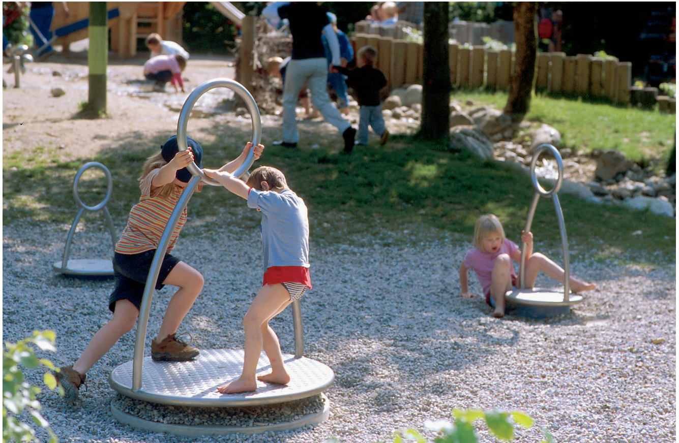
6.26400 carrousel kind / 6.26402 carrousel vader / 6.26401 carrousel moeder