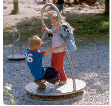
6.26402 carrousel vader