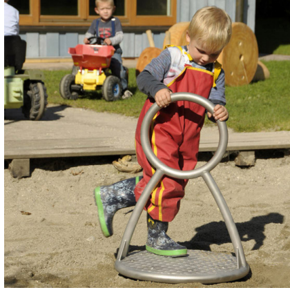
6.26400 carrousel kind

Draaifamilie bestaande uit drie carrouzels met verschillende afmetingen en volledig vervaardigd van roestvrij staal. Carrouzels met grote ringbeugels als handgreep en met vloer van antislip tranenplaat.