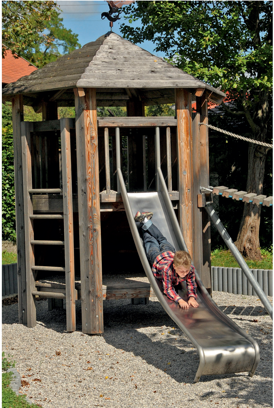
3.16350 zeshoekhut met dak, 3 wanden en 1 bank

Zie bovenstaand, maar met 3 wanden en 1 bank