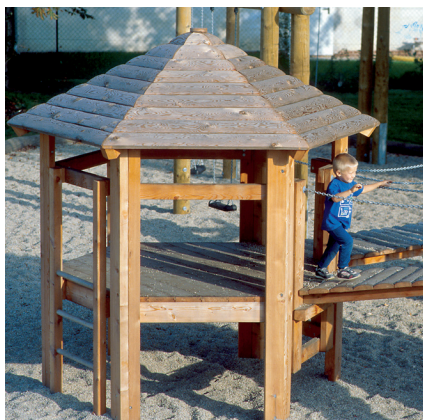
3.15300 kleine zeshoekhut met dak