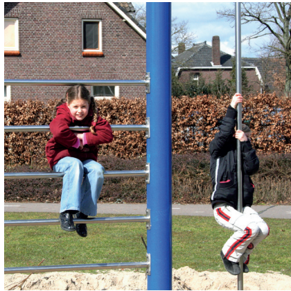
6.72520 turnspeelrij in metaal