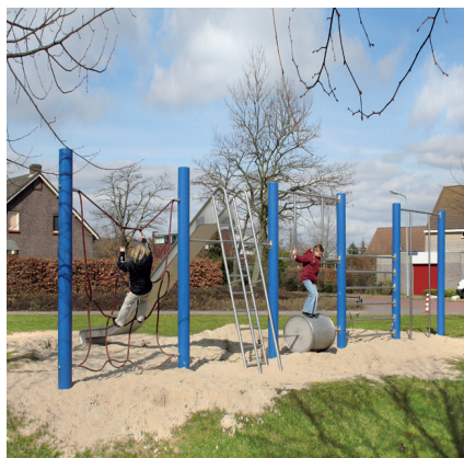
6.72520 turnspeelrij in metaal

Glijbaan wordt niet standaard meegeleverd