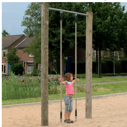
6.72330 klimtouwen, hout