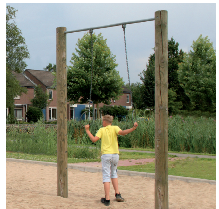
6.72340 ringen, hout