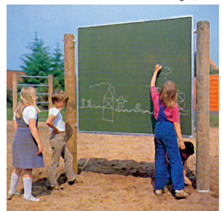
6.72371 tekenbord, hout