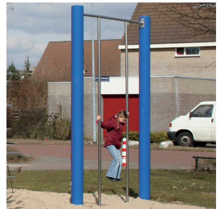
6.72325 klimstangen, staal, optioneel gecoat