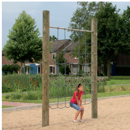
6.72310 kettingnet, hout