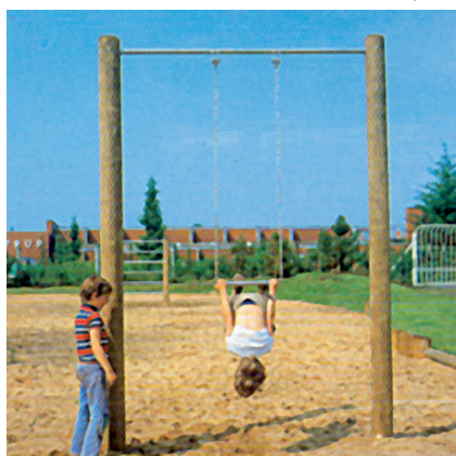
6.72350 trapeze, hout