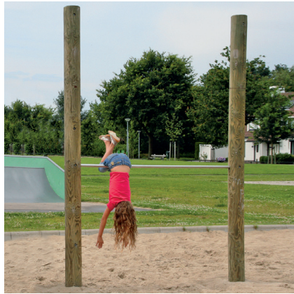
6.72280 duikelrek, hout