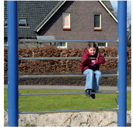
6.72305 sportenwand, staal, optioneel gecoat